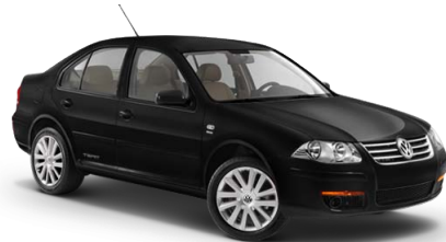
Negro Intenso Profundo